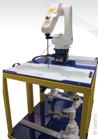
Banc de test pour téléphone portable.