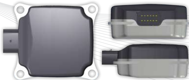
Radar automobile anti-collision 3 ème génération.