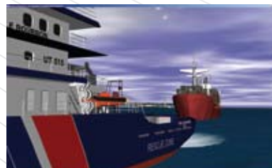
Plan de Secours Global et visualisation de scénarios (Conception : SDIS29 - Réalisation : Inovadys).